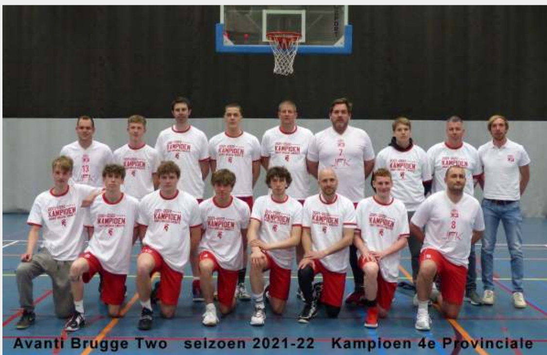
Avanti Brugge Two seizoen 2021-22 Kampioen 4e Provinciale